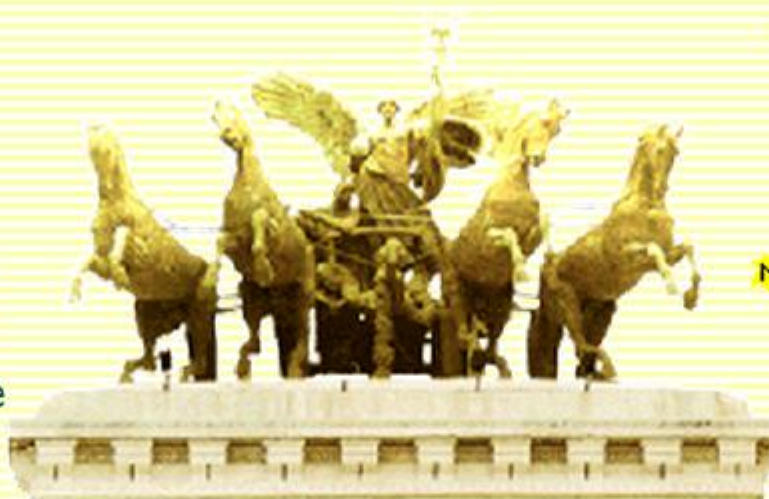
CORTE SUPREMA DI CASSAZIONE Centro Elettronico di Documentazione